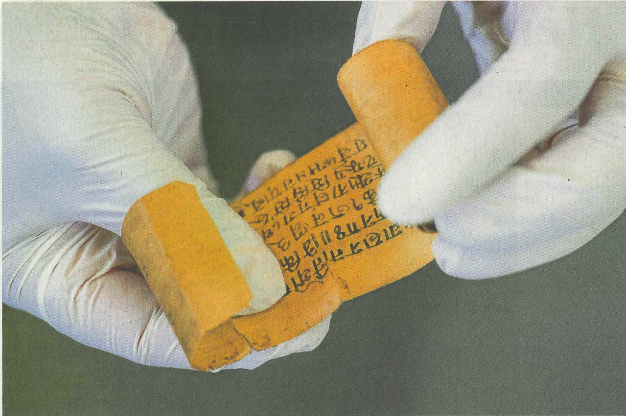
Kulturgut im Kleinformat: Palmbrattrollen wie diese sind die früheste überlieferte Handschrifttradition Nepals. 460 davon wurden nun an der Uni Heidelberg konserviert und dokumentiert. Darunter auch ein Exemplar aus dem Jahr 1242.